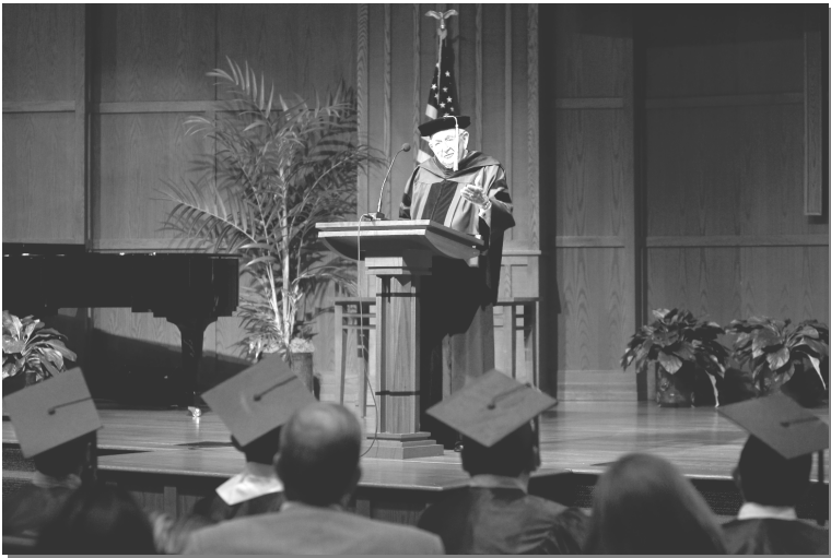
La Ceremonia de Graduación